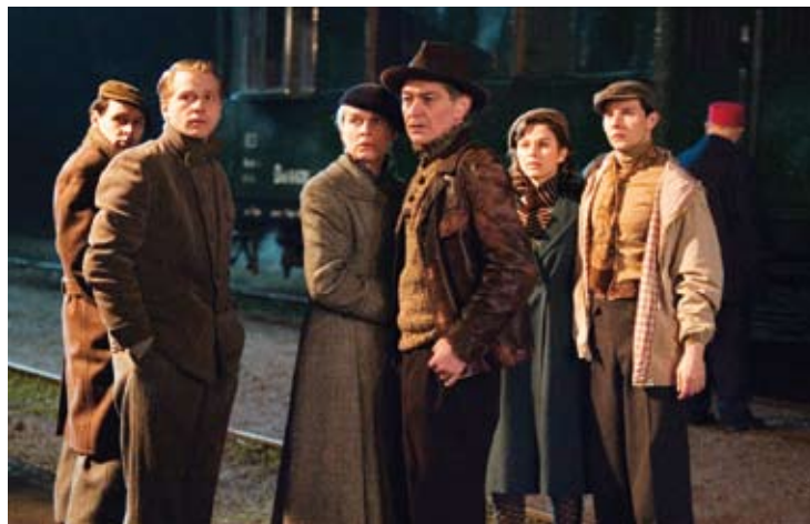
Swingtime: Zatímco se jazzband chystá na přechod hranic ...