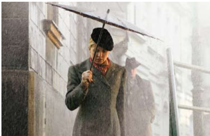
... manželka pianisty zůstala v Praze