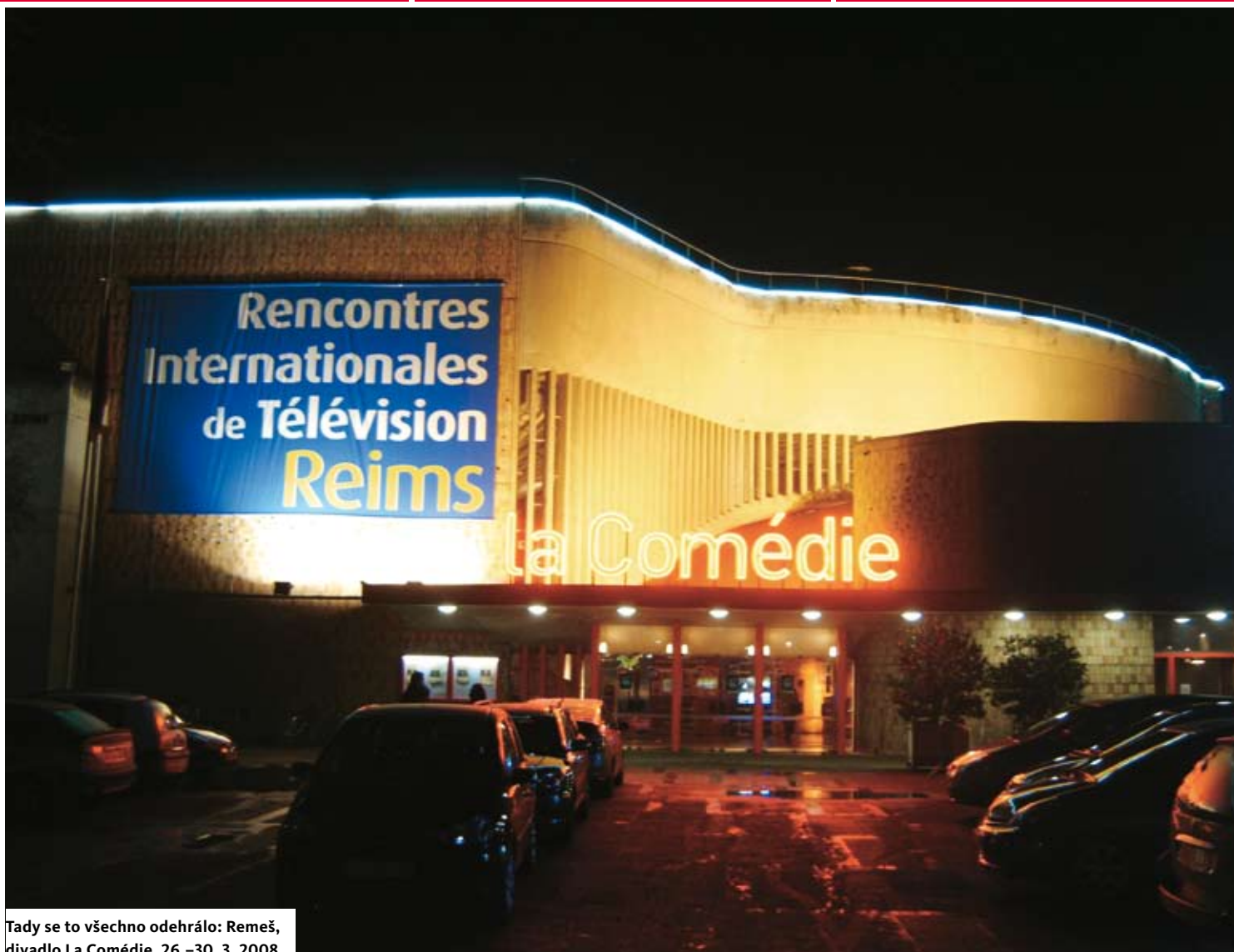
Tady se to všechno odehrálo: Remeš, divadlo La Comédie, 26.–30. 3. 2008